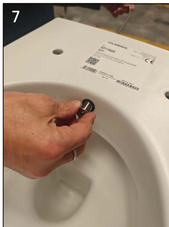
Avvitare l'ugello in acciaio nella propria sede