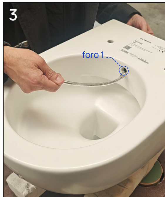
check 1 - foro entrata