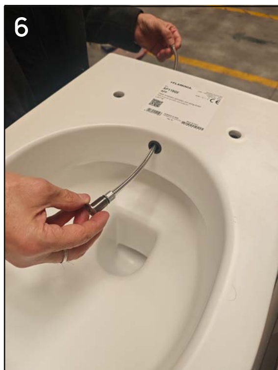
inserire l'erogatore nel canale ceramico