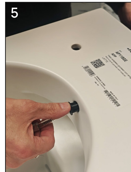
posizionare tassello filettato femmina ad incastro nel foro della ceramica