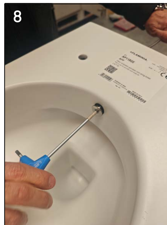
serrare con chiave a brugola senza forzare